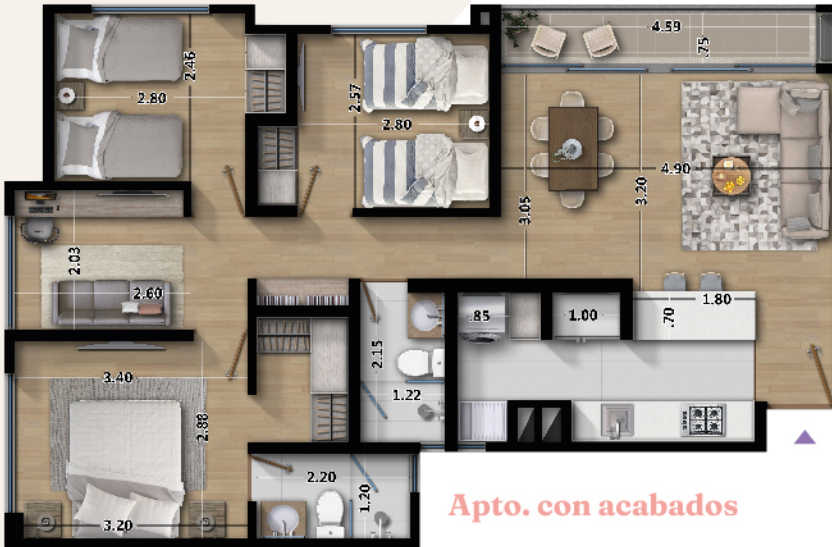
Apto. con acabados