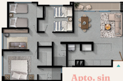
Apto. sin acabados