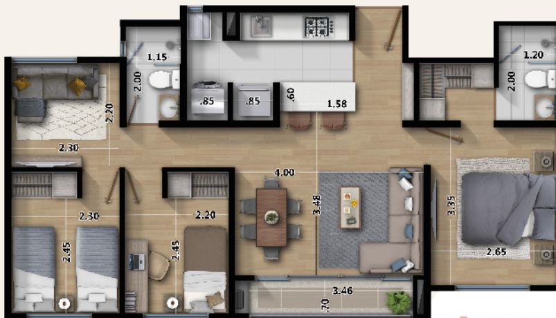
Apto. con acabados