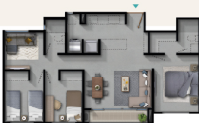
Apto. sin acabados